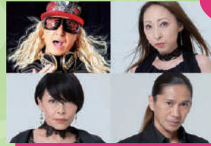
SAM・ETSU・CHIHARU・DJ KOO from TRF