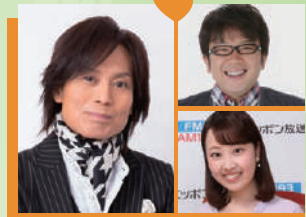
つんく♭ (特別出演) MC: 天野ひろゆき (キヤイ〜ン) 熊谷実帆 (ニッポン放送アナウンサー)