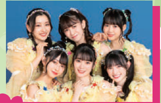
超ときめき♡宣伝部